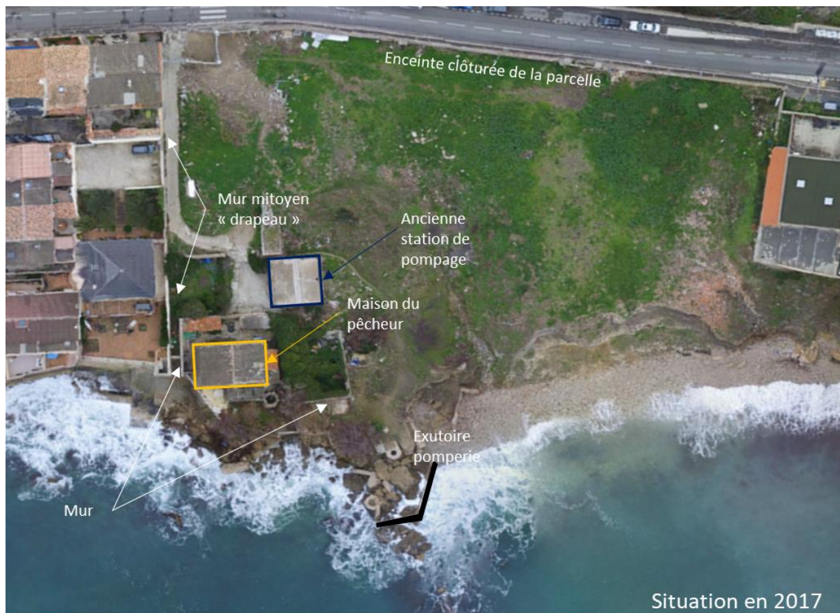
Figure 1 : Situation de la parcelle en 2017

La figure 1 ci-dessous représente la configuration historique de la parcelle à l'acquisition en 2017.